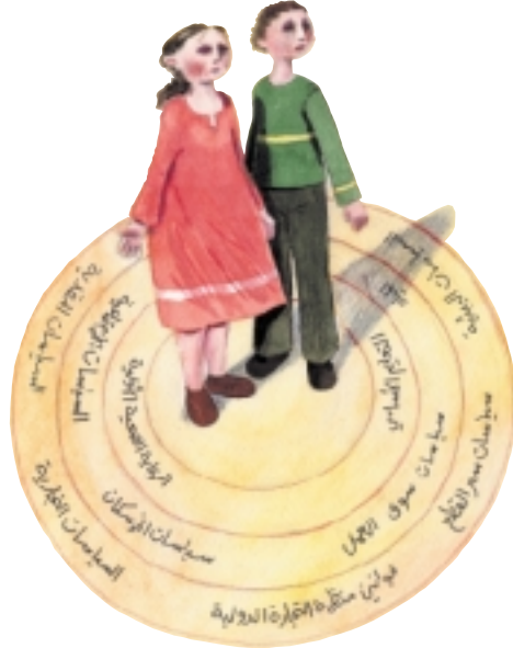
الشكل ١: الطفل في المركز

على سبيل المثال، يمكننا تناول التقدم في ميدان صحة الطفل. ففي حين تُعدّ تدخلات القطاع الصحي المباشرة، بما في ذلك التدابير الوقائية كحمولات التلقيح، بالغة الأهمية وتنتمي إلى الدائرة الداخلية في الشكل (١) أعلاه، فإن من المعترف به عموماً أنّ الانخفاضات المتواصلة في وفيات الأطفال والتحسينات في صحتهم تتحقق بصورة رئيسية عبر التغييرات في العوامل الخارجية، من المداخل المتصاعدة إلى تعليم الوالدين، مروراً بتحسين الغذاء والمياه النظيفة والمسكن الجيدة والأوضاع البيئية الملائمة، إلخ..